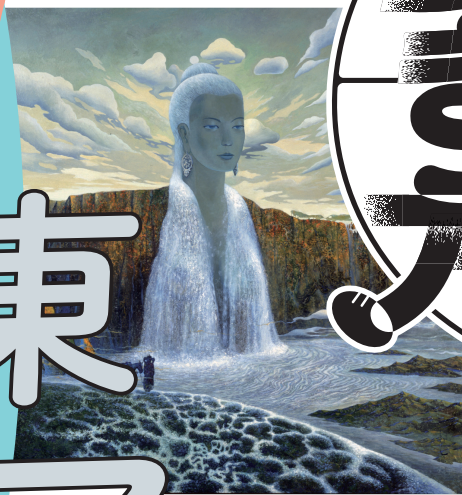
ツェレンナドミディン・ツェグミド [モンゴル]《オルホン河》1993年 Tserennadmidin Tsegmed [Mongolia] Orkhon, 1993

EAST ASIA Exploring Proximity and Difference