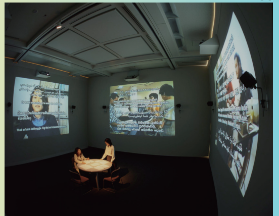
[1] ユン・ヒョングン(尹亨根) [韓国] 《茶青色 337-75 #203》1975年 Yun Hyongkeun [South Korea] Umber-Blue 337-75 #203 , 1975 [2] 作者不詳(チャイナ・トレード) [中国] 《広東のコンスワー邸 #1》19世紀初期 Artist Unknown [China] The House of Consequa, a Chinese Merchant, Canton #1 , early 19th century [3] キャンディー・バード 崔榮梨 [台湾・日本・朝鮮] 《アザーズ-Good Night, and Good Morning》2019年 Candy Bird, Choi Yong Li [Taiwan / Japan / Korea] Others—Good Night, and Good Morning , 2019 [4] 岩井成昭 [日本] 《DIALOGUE》1996-99年 Iwai Shiageaki [Japan] Dialogue , 1996-99