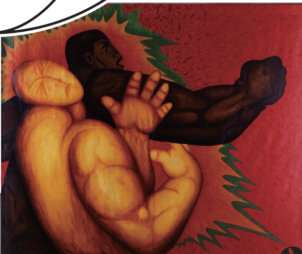
パン・ミンニョ(潘民澤) [中国]《搏击比赛—跆拳道—》1997年 Yang Min-Jin [Taiwan] Behavior of Game Fighting Section, 1997

EAST ASIA Exploring Proximity and Difference