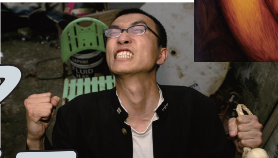
チョ・スプ[韓国] 《かなわぬ恋—無題5》2004年 Jo Seub [South Korea] Tragic Love-No Title 5, 2004