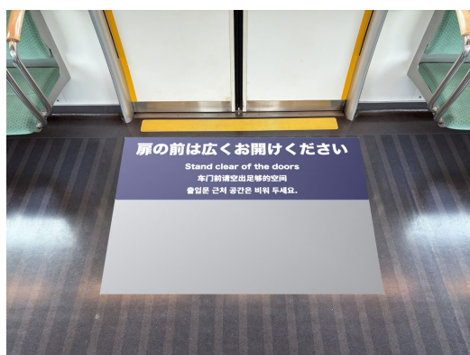
扉付近の床サインイメージ

床サインを扉付近、座席足元付近に追加することで、 扉付近の混雑緩和 及び 座席前の2列利用 を促進します。