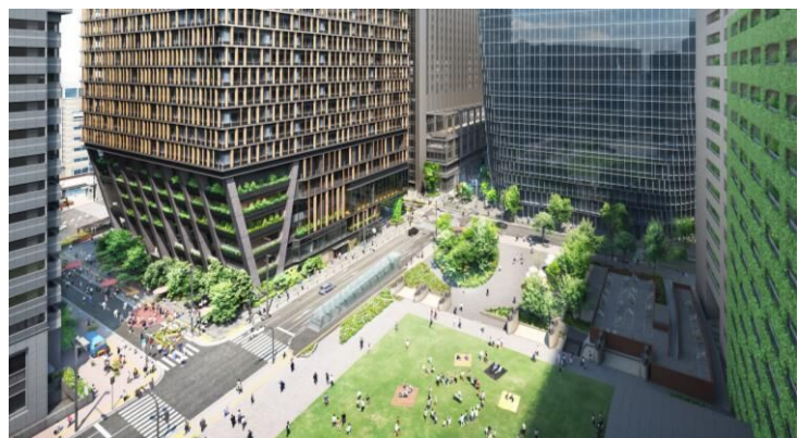
▲建物南東側およびふれあい広場 （広場と建物の緑が連続し、一体的な緑地空間を形成）