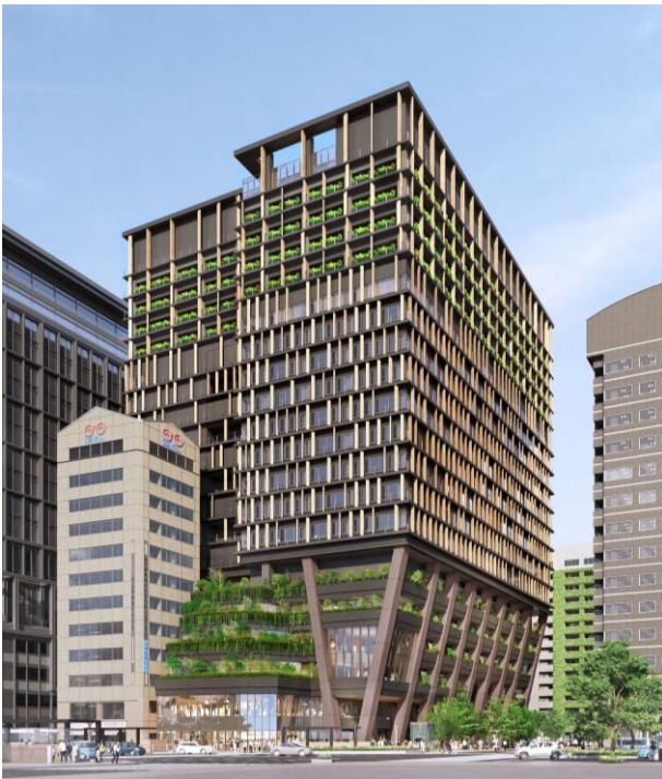
▲建物西側 渡辺通りからの眺め （低層部から高層部までの立体的で豊富な緑化）

本計画では、環境に配慮した未来を想うサステナブルな取り組みと、まちの創造性・多様性と調和した空間づくりを重視しており、緑と花をきっかけに、市民や来街者が自然と集い、心地よく滞在できるひらかれた都市空間の創出を通じて、福岡市が推進する「天神ビッグバン※ 2 」、そして福岡・天神のまちづくりに貢献してまいります。