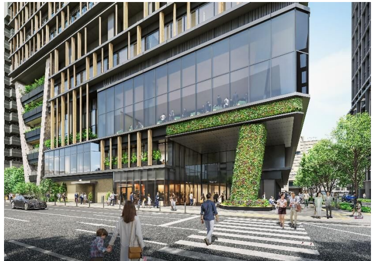
▲建物北東側 福岡市役所西交差点付近 （緑と花で彩られた心地よい広場空間の創出）