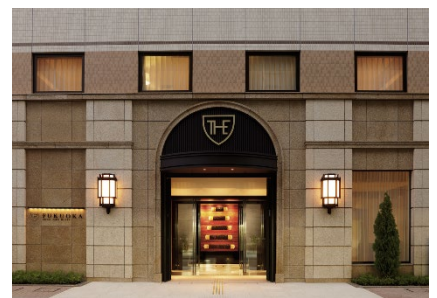
伝統工芸ルーム開発