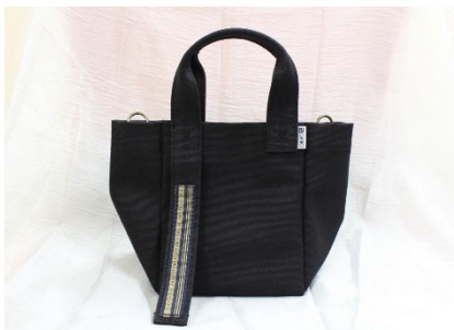
新商品開発（サコッシュ等）