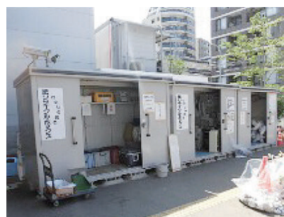
資源物回収ボックス(中央体育館)