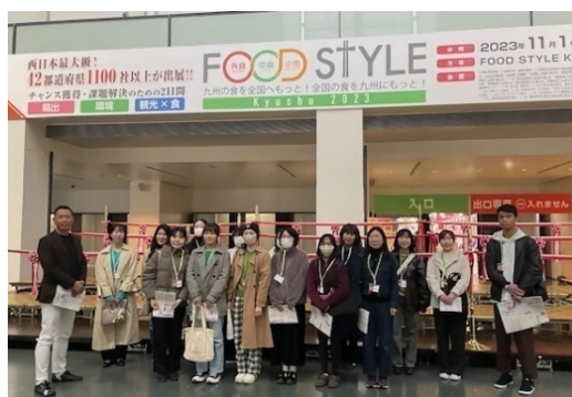
大規模展示会での運営補助体験 (マリンメッセ福岡)