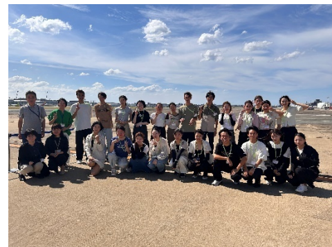
福岡空港の制限エリアも特別に見学! (福岡空港滑走路)