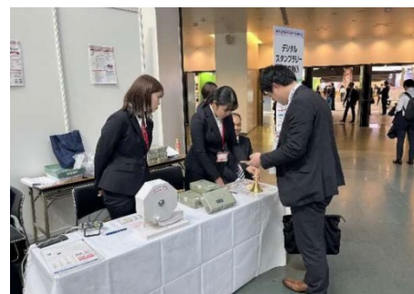
コンベンションの運営補助業務の体験