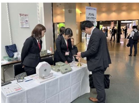
学会での運営補助体験 (マリンメッセ福岡)