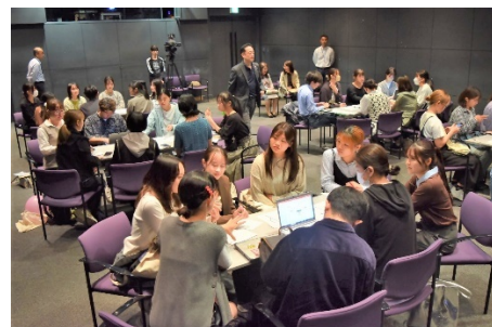
展示会の企画をテーマとしたグループワーク