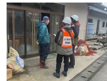
被災者の健康・衛生管理等