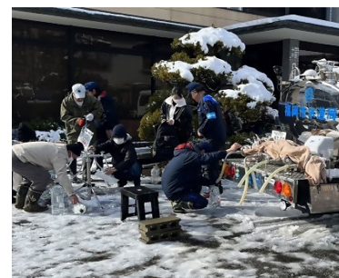
給水車による応急給水