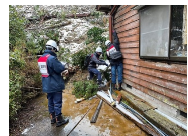
住家被害認定調査