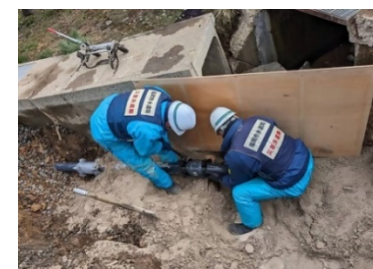
漏水調査及び配水管の応急修理