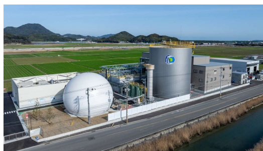
福岡バイオフィードリサイクル 工場 (西区太郎丸790-1)