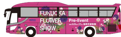
(無料シャトルバスのイメージ)