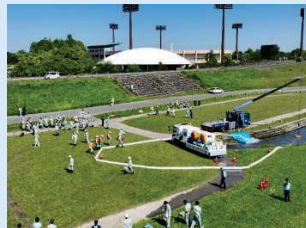
■ドローン操作研修