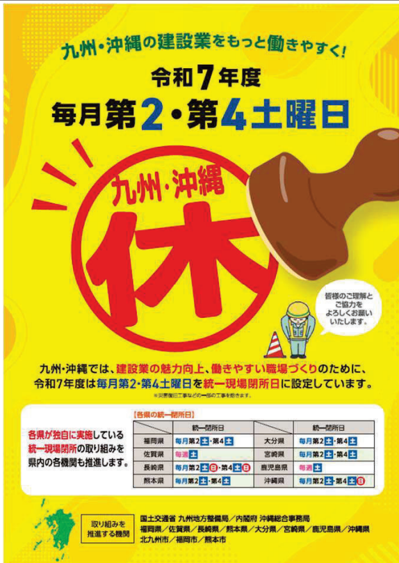
【統一現場閉所日の設定状況】

～ 令和7年度は“毎月第2・第4土曜日”を統一現場閉所日に設定～ さらに各県が独自に実施している統一現場閉所の取り組みを県内の各機関※も推進します