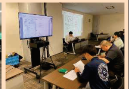
■リモート査定研修