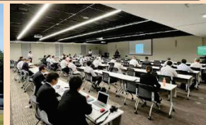
■経営者向け意識改革セミナー