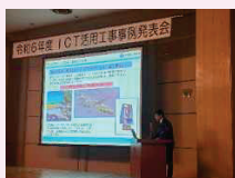
■事例研究発表会(県内業者)