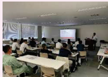
■経営者向けセミナー