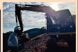
■ICT土木工事現場見学会