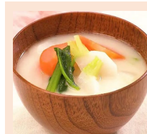
※ 写真はイメージです

児童の育てた「かぶ」を使った豚汁を作って食べます。 食後は、中村学園の教授、学生らによるクイズも交えた食育講座を行います。