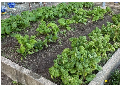
大楠小学校での野菜栽培の様子 (かぶ、かつお菜、ラディッシュ、ほうれん草を収穫予定)