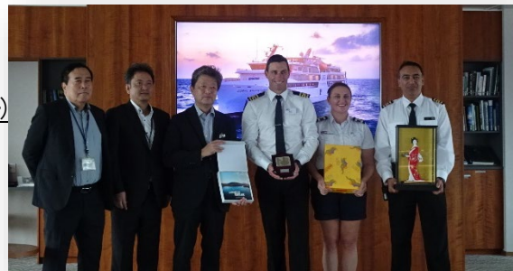
参考：コーラル・アドベンチャラー（R5.10.7寄港）初入港歓迎式典の様子