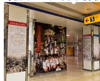
※上図黒矢印方向より撮影