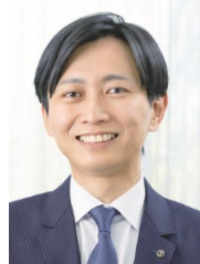
宮崎市長 清山 知憲