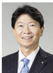
岡山県知事 伊原木 隆太