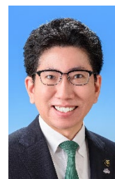
鹿児島市長 下鶴 隆央