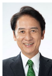
北九州市長 武内 和久