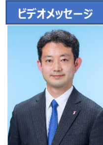
千葉県知事 熊谷 俊人