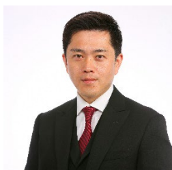
大阪府知事 吉村 洋文