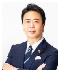
福岡市長 高島 宗一郎