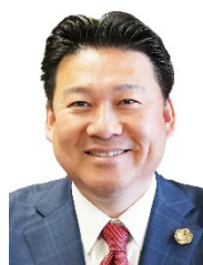
別府市長 長野 恭紘