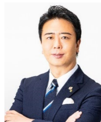
福岡市長 高島 宗一郎