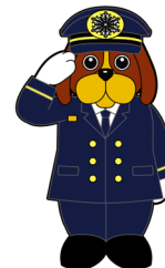
福岡市消防局 マスコットキャラクター ファイ太くん

博多区中洲二丁目～五丁目の飲食店やスナック等が入居するビル （2日間で37対象物を実施予定）