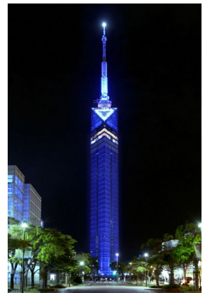
福岡タワーライトアップの様子

福岡市こども未来局こども発達支援課 氷室・米岡 TEL: 092-711-4178（内線1748）