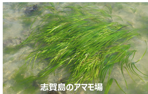
志賀島のアマモ場