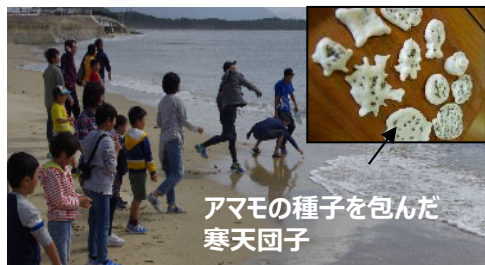
アマモの種子を包んだ 寒天団子