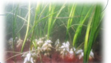
アマモに産み付けられたイカの卵

アマモは、浅い海に育つ海草です。 アマモ場は、「海のゆりかご」と呼ばれ、魚介類 の生息場や産卵場になっています。 また、二酸化炭素を吸収して酸素を出す働きも あることから、 温室効果ガスの削減に役立つ こ とでも注目されています。