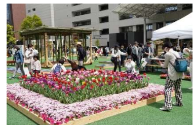
写真については昨年開催時の様子