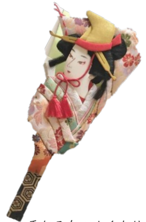
重なる布のぬくもりと美しさ 博多おきあげ