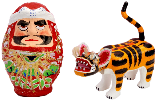
庶民の中で愛された玩具 博多張子