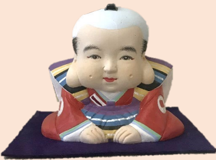
昔ながらの特徴を受け継いでいる 民俗土人形 今宿人形