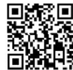
はかた伝統工芸館