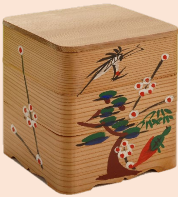
伝統を受け継いで約400年 博多曲物