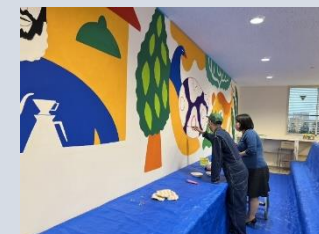
【企業施設内での作品制作・掲出】