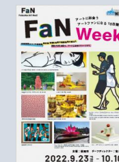
【FaN Week 連携企画】