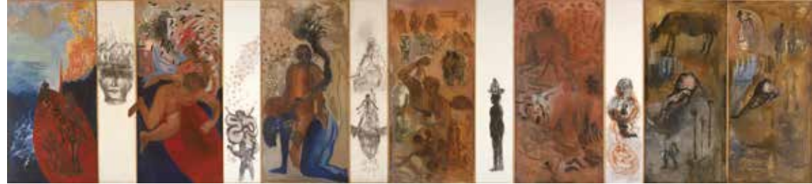
ナリニ・マラニ《略奪された岸辺》1993年 Nalini Malani, Despoiled Shore, 1993