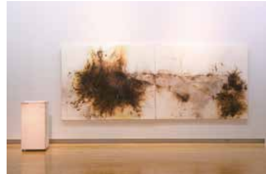
ツァイ・グオチアン(蔡國強) 《天地悠悠：外星人のためのプロジェクト No.11》1991年 Cai Guoqiang Immensity of Heaven and Earth: Project for Extraterrestrials No.11 1991

約5,000点のコレクションから選りすぐった10名24点の作品は、いずれもアジア現代アートの高みを示しています。アジアのトップアーティストにフォーカスした本展が、みなさまに新鮮な体験と感動をお届けできることを願っております。