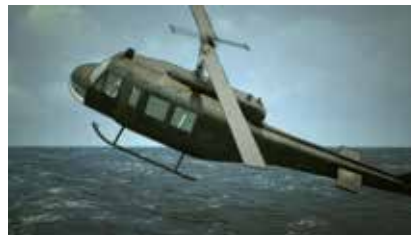
ディン・キュー・レ《南シナ海ピシュクン》2009年 Dinh Q. Le, South China Sea Pishkun, 2009