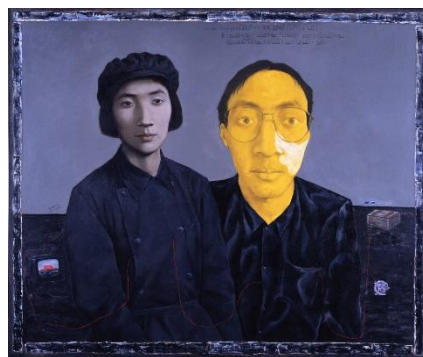
ジャン・シャオガン 《若い娘としての母と画家》1993年