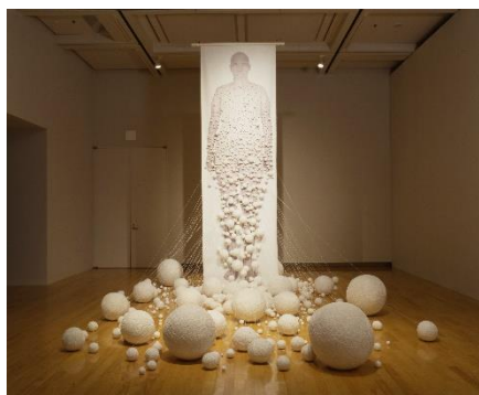
リン・ティエンミャオ 《卵 #3》2001年