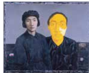
ジャン・シャオガン(張曉剛) 《若い娘としての母と画家》1993年 Zhang Xiaogang Painter with Mother as a Young Woman 1993