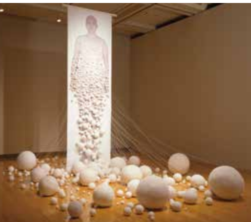
リン・ティエンミャオ(林天苗)《卵 #3》2001年 Lin Tianmiao, Spawn #3, 2001