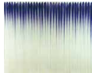
イ・ウファン(李禹煥) 《線より》1977年 Lee Ufan, From Line, 1977