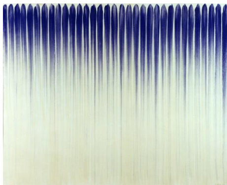
イ・ウーファン 《線より》1977年