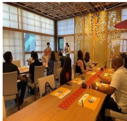
（参考）以前のFAMトリップの様子