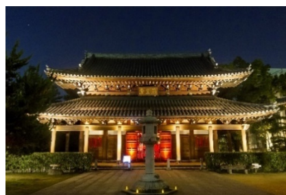
(参考) 博多旧市街ライトアップウォーク