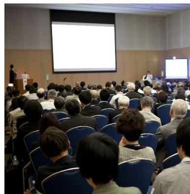
(参考) 以前のセミナーの様子

⇒ 世界水泳大会開催期間中に観光案内所で活躍した福岡グローバルMICE スクールの学生もボランティアスタッフとして参加します。今までの研修で学んだ「おもてなし」の心得や英語での対応等を活かし、心を込めてお客様に対応します。