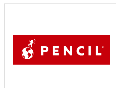
No.3 株式会社ペンシル