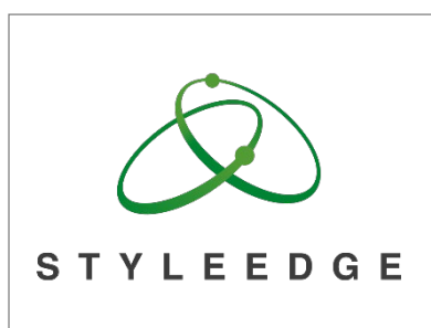
No.1 株式会社スタイル・エッジ

エンジニアのスキルアップにつながる取組みや働きやすい環境づくり、コミュニティ活動への支援等を行っている企業