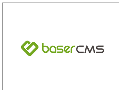
No.2 baserCMS コミュニティ