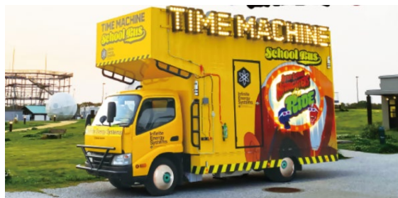
体感型 3D ライドアトラクション 「放課後ミッドナイト・ザ・ライド」