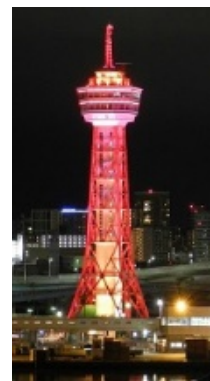
博多ポートタワー