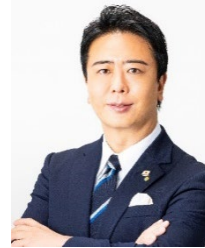
福岡市長 高島 宗一郎