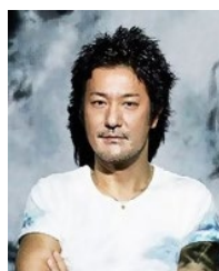
チームラボ代表 猪子 寿之