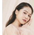
モテクリエイター・実業家 ゆうこす