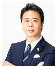
福岡市長 高島 宗一郎