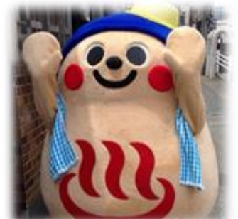
福岡市支部キャラクター 「温（おん）まるくん」