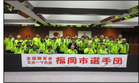
前回(第18回:H30)大会 表敬訪問の様子