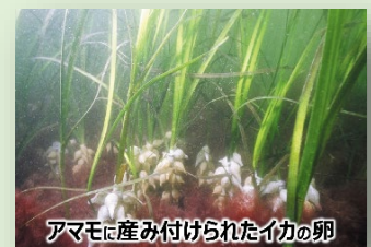
アマモに産み付けられたイカの卵