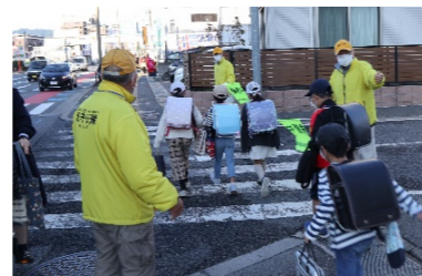
地域活動（子どもの見守り）