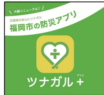
福岡市防災アプリ ツナガル+