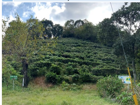
2 茶畑 # 傾斜地 # 現在の利用頻度は低い(年に数回茶摘み体験で使用)