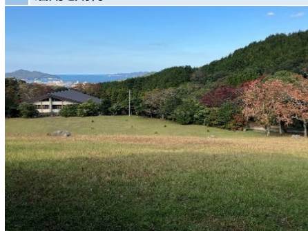
9 自由広場の傾斜部分 # 傾斜地 # 海が見える眺望 # 斜面プラスαの活用を期待