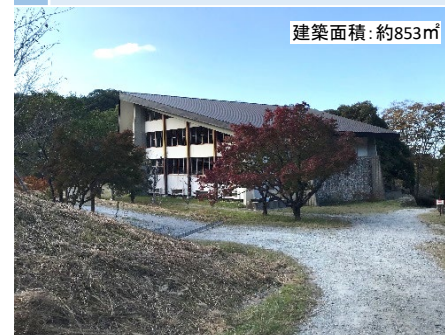
4 ミーティングホール (改修予定) # 平地