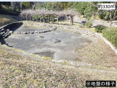
6 臨時駐車場 # 平地 # 現オートサイト