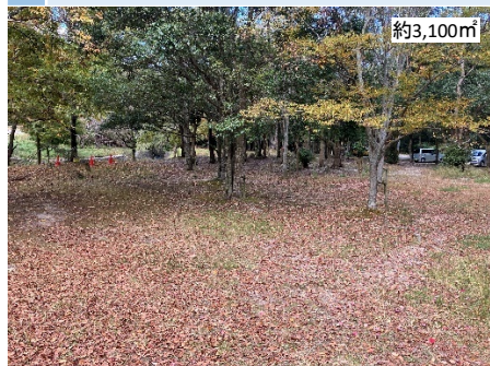
1 入口付近 # 平地 # 一部国有地あり