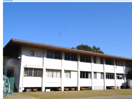
3 セントラルロッジ (建替え予定) # 事務室 # 研修室 # シャワー機能あり