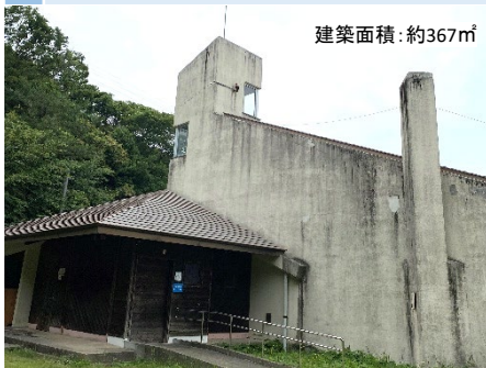
17 旧浄化槽跡地 (第2駐車場上)