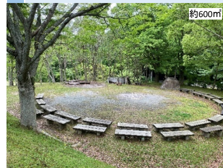
7 第2 営火場 (解体撤去予定) # 平地 # ベンチあり # 現オートサイト