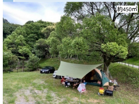
6 臨時駐車場 # 平地 # 現オートサイト