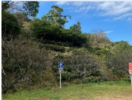
18 第4 営火場

# 平地 # 隣接するファミリーロッジなどの調理場、営火場、デイキャンプとして使用