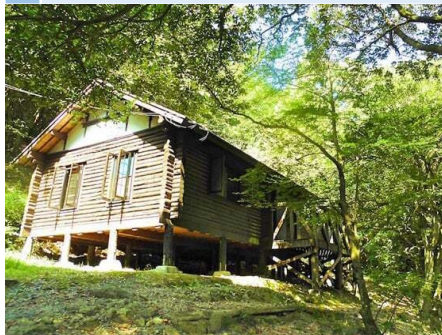
19 自由広場とセントラルロッジの間