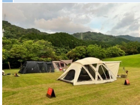
8 自由広場の平地部分 # 平地 # 現テントサイト (一部)