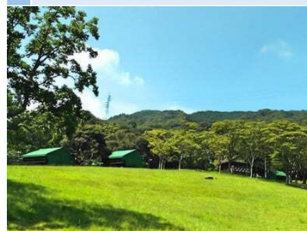
10 固定テント・ファミリーロッジ (撤去予定) # 平地+一部傾斜地 # 海が見える眺望