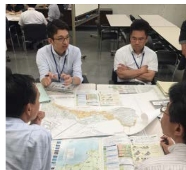
より実現性の高い事業となるよう、企画段階からNPOと市担当課において協議を行いプレゼンに臨みます。

人材不足に悩む企業に対し、段階的なセミナー等の教育支援事業を実施することで、外国人受入れに関する基礎知識習得・ノウハウの共有を図る。