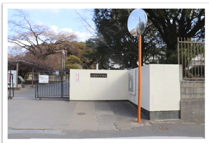
福岡教育大学附属福岡中学校