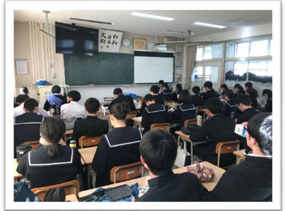
放送中の生徒たちの様子（R7年12月）

（※福岡市人権尊重週間…人権が真に尊重され、差別のない住みよい福岡市の実現に向け、福岡市では12月4日～10日を「福岡市人権尊重週間」と定めている。）