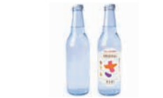
さわらの秋オリジナルサイダー6本セット