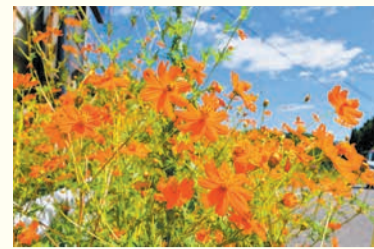
石釜のキバナコスモス

開 = 日時 所 = 場所 問 = 問い合わせ ☎ = 電話 ㊄ = ファクス 対 = 対象 定 = 定員 料 = 料金、費用 持 = 持参 託 = 託児 申 = 申し込み 電 = メール 開 = 開館時間 休 = 休館日