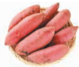
馬場ファームの採れたてサツマイモ

問さわらの秋企画運営委員会(区企画課内) ☎833-4412 ㊄846-2864