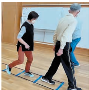
ラダー運動の様子(はしごを使い小刻みにステップを踏む)

この日は、毎回実施しているラダー運動のほか、ディスコン、お手玉ビンゴ(2つのチームに分かれて対戦するレクリエーション)も行いました。使用する道具は手作りです。