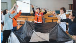
避難所で使うテントを組み立てる参加者

5月17日(土)に長尾小学校で、市民総合防災訓練が行われました。小学校の土曜授業に合わせて、区と長尾校区自治協議会、長尾小学校が合同で実施し、地域住民や、長尾小学校の児童など約1,000人が参加しました。