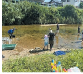
友泉亭橋上流で生き物探しをする親子

夏の樋井川と油山 身近な自然と触れ合おう 憩いの水辺樋井川 自然に親しむ油山 樋井川は、区の南から北に向かって流れ、都市部にありながら、自然の豊かさを感じられます。オイカワやコイなどの川魚や、アオサギやハクセキレイなどの野鳥が見られ、一年を通じて多くの生き物に出会えます。友泉亭橋上流付近では、川遊びも楽しむことができます。安全のため、子どもだけでは川に近づかないようにしましょう。