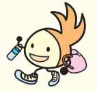
区のシンボルキャラクター 油山の妖精「ニッコリン」

〒814-0192 城南区烏飼六丁目1-1 窓口受付時間：午前8時45分～午後5時15分 (土・日曜・祝休日・年末年始を除く) 区ホームページは「福岡市城南区」で検索