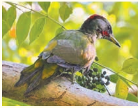
アオゲラ (油山市民の森)