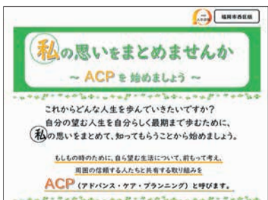
西区版エンディングノート

また、自分の望む人生を最後まで自分らしく生きることを目指す、西区版エンディングノート「私の思いをまとめませんか」の普及啓発を進めています。