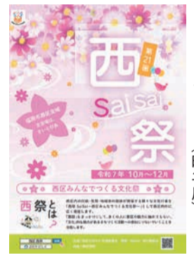
リーフレット(昨年度)

☎10月～12月中旬に区内で開催される文化関連の行事(11月の行事を優先して掲載)。部門は、音楽、舞踊・民舞、演劇、文芸、茶華道、美術、歴史など。