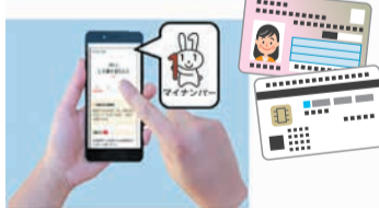
スマホでの手続きをサポート

区役所が混み合う時期に、転出届等のオンライン手続きをサポートするコーナーを設置します。また、区役所に設置されたマルチコピー機での各種証明書の発行をサポートします。