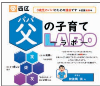
西区パパの子育てLABO

父親が積極的に子育てに参加し、安心して子育てできるよう、父親向け講座「西区パパニティ」や「西区パパの子育てLABO(ラボ)」を開催します。