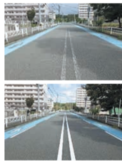
道路区画線の引き直し

また、見えにくくなった道路区画線の早めの引き直しや、公園のトイレ環境の向上などに取り組めます。