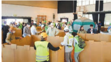
区市民総合防災訓練の様子

リニューアルオープンする今宿野外活動センターでの防災キャンプの実施や、地域の個別避難計画の作成を支援し、「自助共助」による地域の防災力の向上を図ります。