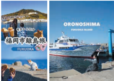
インフルエンサーによる情報発信

SNS上で影響力を持つインフルエンサーなどによる魅力発信や、島民による縁結びイベントの運営支援などを行います。島外の人に島のことを知ってもらうことで、離島の活性化に取り組みます。