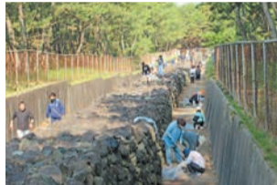
みんなで防塁をきれいに

今津校区の住民などで構成される「今津元寇防塁・松原愛護会」が毎月第一土曜日を「防塁・松原清掃の日」として決め、みんなで防塁をきれいに活動しています。