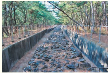
国指定史跡の今津元寇防塁

西区役所 代表電話 ☎881-2131 〒819-8501 西区内浜一丁目4-1 西部出張所 ☎806-0004 〒819-0367 西区西都二丁目1-1