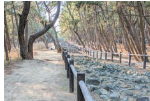
整備された遊歩道

以前は、子どもの背丈ほどの雑草が生い茂り、不法投棄などが多く、治安の面で不安があったそうです。今では、元寇防塁を囲むように遊歩道が整備され、ジョギングを楽しむ地元の人や、遠方から史跡を見学に来る人が増えてきています。