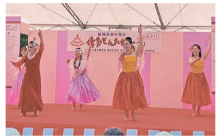
華やかな衣装もお楽しみに