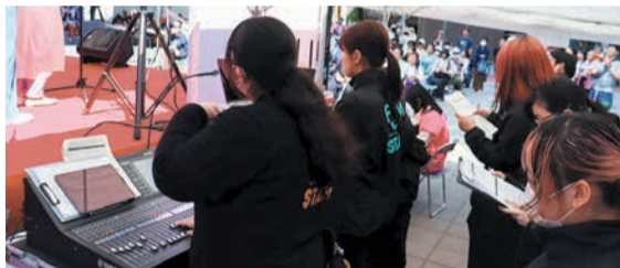
専門学生が演舞台の音響・機材を担当。出演者ごとに音響を微調整します

博多どんたく港まつりは 博多区演舞台で楽しもう 5月3日(土・祝)と 4日(日・祝)の2日間、 福岡市民のお祭り「博多 どんたく港まつり」が開 催されます。今年のテ ーマは「生まれ変わるまち 笑顔の花咲く」です。博 多区では、区役所南側広 場に演舞台を設置し、さ まざまな団体が祭りを盛 り上げます。 多彩なパフォーマンス を披露 3日午前9時30分〜午 後3時、4日午前10時〜 午後4時に、さまざまな 団体が、和洋を問わず歌 や踊り、演奏など演技を 披露します。 3日は国の重要無形民 俗文化財・博多松囃子の 表敬訪問が、4日は市民 の祭り振興会訪問団を迎