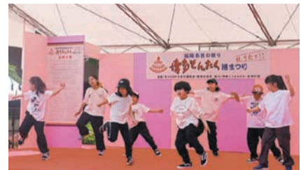
子どもたちが元気いっぱいに踊ります

専門学校の学生 との共創 博多区役所1階で、博 多区内の専門学校に通う 学生らがブースを設けま す。普段の学びの成果を えての歓迎式典が行われ ます。 各団体の出演時間等に ついては、ホームページ 「博多区演舞台」で検索 や当日会場で配られるパ ンフレットでご確認ください。 子どもたちが元気いっぱいに踊ります