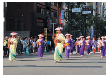
午後2時50分から博多区演舞台に出演します。どんたく隊は榎田神社も訪問し、踊りを披露します。