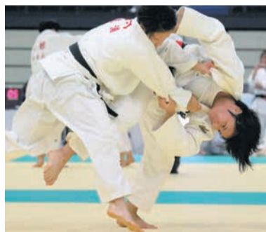
昨年の柔道女子3回戦 大牟田(福岡)ー瓊浦(けいほ/長崎)

全国から約1300校、1万人を超える高校生が集まります。予選を行わないトーナメント方式の対抗勝ち抜き戦による団体戦で、これまでに数々の名場面が生まれました。高校柔剣道の日本一決定の瞬間を、ぜひ会場でご覧ください。