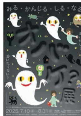
絵本「ねないこだれだ」を朗読する「オバケ落語」の上映

22組のクリエイターが生み出す、絵本、漫画、落語、アニメーション、音楽、写真など、ワクワクするオバケが大集合します。オバケを展覧会で楽しみ尽くしましょう。