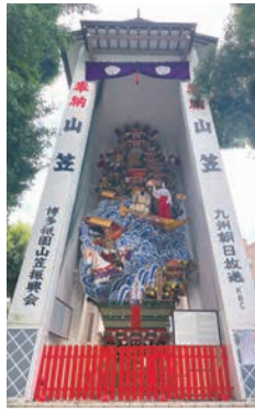
榊田神社の飾り山笠

毎年7月1日から、市内の13カ所で豪華絢爛な「飾り山笠」が公開されます。博多人形師が趣向を凝らし丹精込めて制作したもので、15日未明には解体され、翌年作り替えられます。