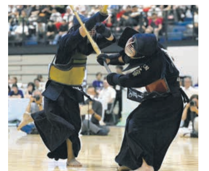
昨年の剣道男子決勝 福岡大大大ー福岡第一

期▽金鷲旗(柔道) 7月22日(火) 24日(木)▽玉竜旗(剣道) 7月25日(金) 29日(火) 市総合体育館(東区香椎照葉六丁目) 一般1200円、高校生800円、中学生以下無料 ※チケットの販売は、金鷲旗が7月5日(土)午前10時から、玉竜旗が6日(日)午前10時から