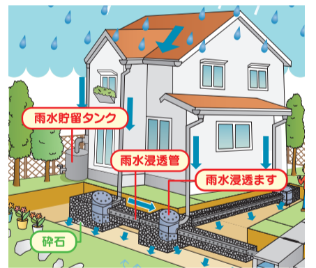
たまった水は、植栽の水まきなどに使用できます

屋根の雨どい等から雨水を貯留タンクにためたり、浸透施設を設置して雨水を地下に浸透させたりすることで、一気に河川や水路に流れ込むのを防ぎ、豪雨による浸水被害を軽減することができます=右イラスト参照。助成は1家屋につき1度のみです。購入・工事の前に下水道管理課へ、必ずご相談ください。