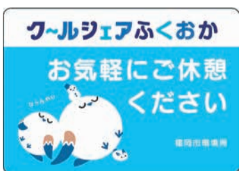
クールシェアスポットはステッカーやのぼりが目印です。用事がなくても涼む目的で利用できます

クールシェアスポットは市ホームページ(「福岡市 熱中症情報」で検索)で紹介しています。外出時に上手に利用して熱中症予防に役立ててください。