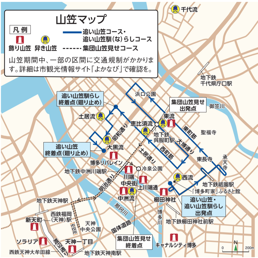
飾り山笠は、上記以外に博多駅商店連合会(JR博多駅博多口)、福岡ドーム(マークイズ福岡もち)、渡辺通一丁目(サンセルコ)にもあります