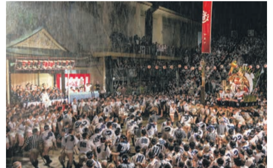
榊田神社の境内に設けられた清道旗を回る、一番山笠・大黒流(昨年)