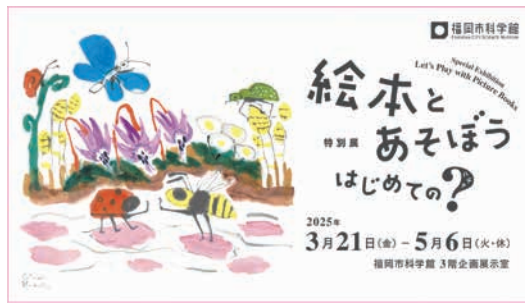
同展メインビジュアル