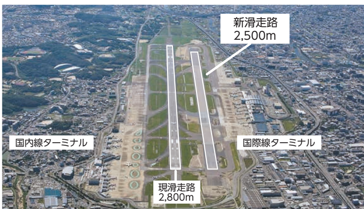
福岡空港全景(北から南方向を望む)

滑走路の増設に伴い、利用者の増加が見込まれることから、国際線旅客ターミナルビルの増改築工事も行われています。3月28日(金)にグランドオープンします。