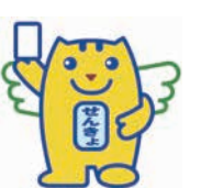
明るい選挙推進キャラクター「選挙のめいすいくん」

3月23日(日)は、県知事選挙の投票日です。投票時間や場所の詳細は、有権者に届く投票所入場整理券(はがき)等でご確認ください。入場整理券がなくても、選挙人名簿に登録されていれば、本人確認後に投票できます。