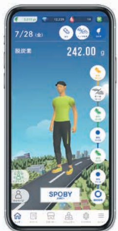
スポビー画面イメージ

同アプリ内の市民向けコミュニティ「脱炭素エキデン福岡」に参加し、▷移動手段を乗り物から徒歩や自転車に切り替える▷マイボトルを使うなどの脱炭素につながる行動を行い登録する一などを行うと、その行動によるCO 2 排出削減量が表示され、ランキング形式でも確認することができます。また、これらの脱炭素行動に取り組むとポイントがたまり、特典と交換することができます。楽しみながら脱炭素行動を続けてみませんか。