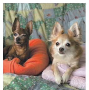
うちのわんこたち (早良区 60代)

住所・氏名・年齢を記入の上、はがきか封書、またはメール(☎shiseidayorioubo@city.fukuoka.lg.jp)で広報課「ハッピーボックス」係(〒810-8620住所不要)へ。写真やイラストもお待ちしています。 *氏名は掲載しません。