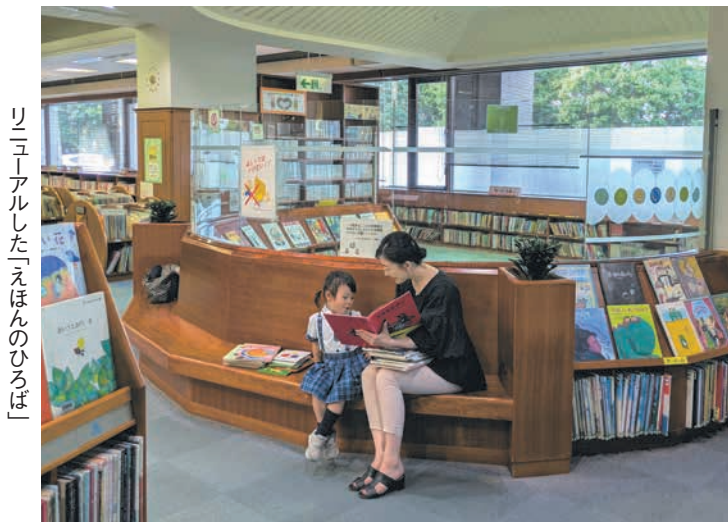
リニューアルした「えほんのひろば」