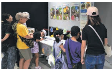
8月に行った名前候補募集

10月12日(土)～27日(日)に、10案の中から4頭のゾウの名前を決める、来園者による投票を動植物園内で行います。10案は、8月に実施した名前候補募集に応募された6,408件の中から動物園職員全員で選考したものです。投票用