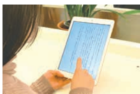
タブレットでも楽しめます

図書館に行かなくても、スマートフォンやパソコン・タブレットで電子書籍を借りて読むことができます。実用書や不朽の名作、英語の本、子ども向けの「読み放題」の本など、1万2千冊を超える蔵書の中から選べます。