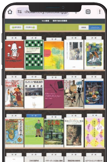
検索した本や関連する本が表示されます(イメージ図)