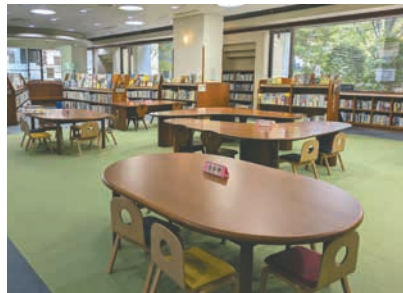
子どもたちの読書・調べ学習スペース