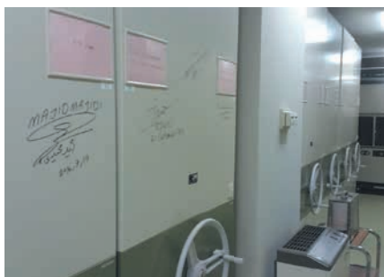
長期の映像保存が可能なフィルム収蔵庫は、日本では国立映画アーカイブと当館のみ。壁には、映画監督等の直筆サインも

2階には、福岡に関する資料を集めた「郷土・特別資料室」や行政資料などを閲覧できる「文書資料室」があり、古文書などの貴重な資料をデジタル画像やマ