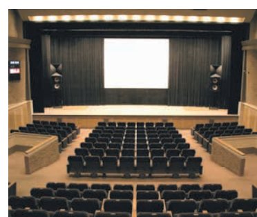
65歳以上の市民は本人確認書類(名前、住所、年齢が確認できるもの)を提示すると半額に

イクロフィルムなどで見ることでできます。資料が見つからない場合などは、レファレンスカウンターにご相談ください。