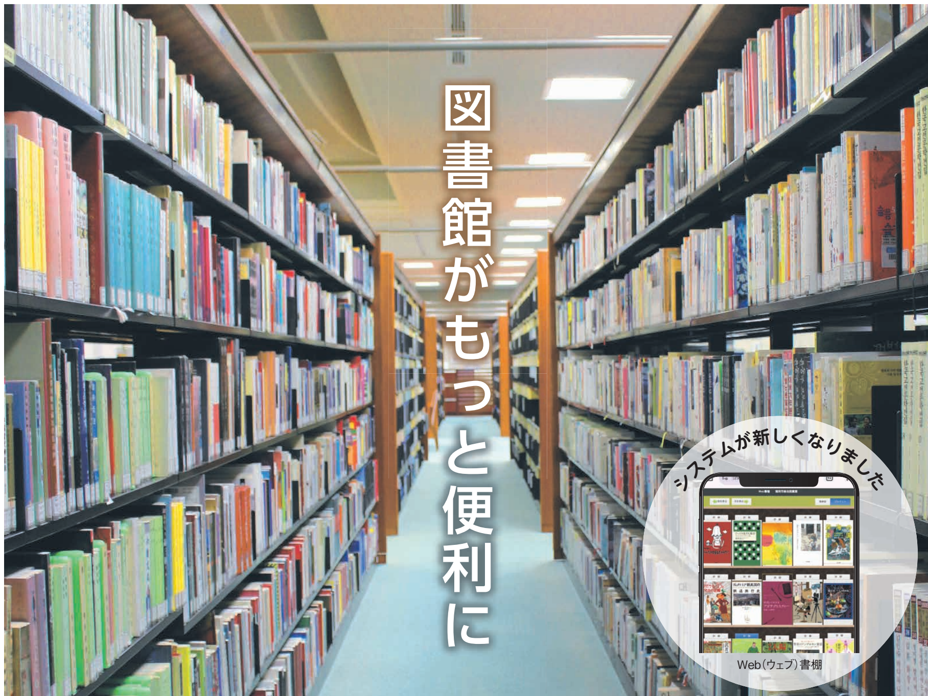
市総合図書館(早良区百道浜三丁目) 2階