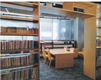
南市民センターにある南図書館。各分館でも、「おはなし会」などの催しや展示も実施

総合図書館には、11の分館があります。総合図書館や他の分館の本でも、予約の際に受け取