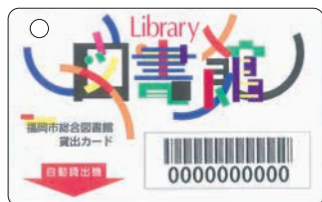
図書館貸出カード

図書館のホームページから、新システムや電子図書館を利用できます。検索した本の予約や電子図書館の利用には、貸出カードに記載の番号とパスワードが必要です。貸出カードの申請は3面でご確認ください。パスワードは、ホームページの「ログインする」の「ログイン認証」から設定できます。