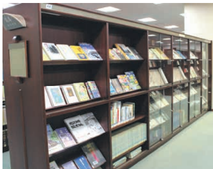
郷土・特別資料室では季節ごとにテーマを決めて資料の展示を行っています

総合図書館では、市の歴史的公文書、行政資料、郷土の資料、古文書、福岡ゆかりの作家に関する文学資料などを収集・整理・保存して、調査研究を進めています。