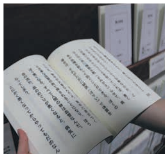
小さい文字が読みづらい人向けに、文字を大きく印刷した「大活字本」もあります