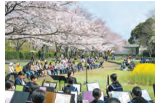
過去のステージイベント

飲食物の販売や露店の出店のほか、ひょっとこ踊りや中学校吹奏楽部の演奏などステージイベントもあります。開3月30日(土)、31日(日)午前10時～午後4時 料入場無料 申不要