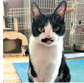
管理番号:c4144 品種:雑種 性別:雌 年齢:10歳 毛色:黒白

福岡東部動物愛護管理センター(東区蒲田五丁目) ☎691-0131(平日午前8時30分～午後5時) ☎691-0132