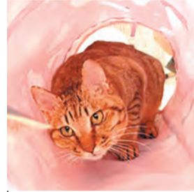
管理番号:c4385 品種:雑種 性別:雌 年齢:1歳 毛色:キジ