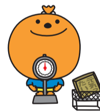
市健康づくりキャラクター「よかろーもん」

30分～10時30分⑫4月7日(日)午前8時30分～10時30分⑬4月28日(日)午前10時～正午 市内に住む人。※①は市国民健康保険加入者、①は⑨か⑩の受診者で喫煙など一定の条件の該当者 先着順 一部減免あり 電話かメール(☎yoyaku@kenkou-support.jp)、来所で2日前までに予約を。3カ月～小学3年生(無料。希望日の4日前までに要予約)