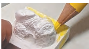
金印の石こう模型に色を塗る体験もできます

国宝の金印がどのように使われていたのか、複製品を使って体験します。開3月23日(土)午前10時～正午、午後1時～3時(受け付けは各終了時間の30分前まで) 定員100人(先着) 料無料 申不要