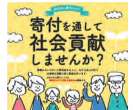
「あすみん夢ファンド」への寄付をお願いします

NP0活動支援基金(あすみん夢ファンド)への寄付金を基に、福祉や教育・文化、まちづくり、子ども育成、環境など、さまざまな分野で活動するNP0法人の公益的な事業に対し助成を行います。寄付する際に、支援したいNP0法人や希望の活動分野を選べます。詳細は市ホームページで確認を。☎市民公益活動推進課 ☎711-4283 ☎733-5768