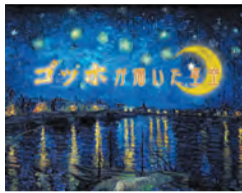
ゴッホが描いた星空 キービジュアル

当時の星空の再現を交えながら、画家・ゴッホの作品と書簡を基に、彼の星空に対する思いに迫ります。番組のスケジュールなど詳細はホームページで確認を。開開催中～6月3日(月)小学生高学年以上(推奨) 定員各回220人(先着) 料大人510円、高校生310円、小中学生200円、未就学児無料 開当日午前9時30分から3階チケットカウンターで販売。