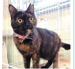
管理番号:c4440 品種:雑種 性別:雌 年齢:3歳 毛色:サビ