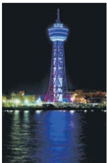
博多ポートタワーのみ、4月3日(水)～8日(月)午後7時～翌午前0時も点灯