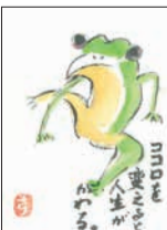
イラスト (南区 90代)

住所・氏名・年齢を記入の上、はがきか封書、またはメール(✉shiseidayorioubo@city.fukuoka.lg.jp)で広報課「ハッピーボックス」係(〒810-8620住所不要)へ。