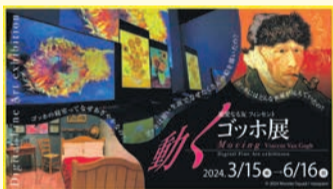
動くゴッホ展福岡会場のバナー

同展チケットをペアで5組にプレゼントします。はがきに住所・氏名・年齢と「あなたが最近幸せを感じたこと」を書いて、3月20日(必着)までに広報課「動くゴッホ展」係(〒810-8620住所不要)へ。当選者に直接チケットをお送りします。