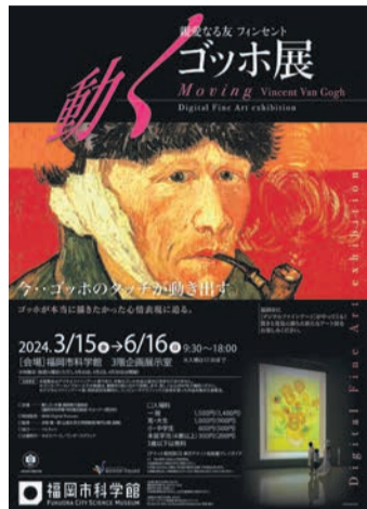
動くゴッホ展福岡会場のポスター(ゴッホ自画像)

映像制作は、米国ハリウッド映画界を中心に50作品を超えるCGI(3DCGアニメーションや特殊効果等)を手掛けたデジタルアートスタジオ・MDK。世界各国のゴッホ作品約860点が集結し、うち約40点を「動く絵画」として展示します。新たな世界をお楽しみください。(企画制作:ネオスペース/ワンダースクワット)