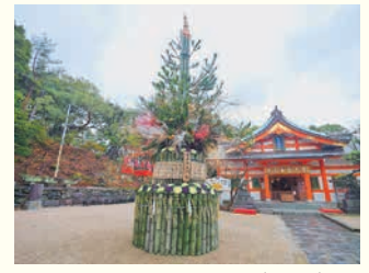
紅葉八幡宮の門松(昨年)

開 = 日時 所 = 場所 問 = 問い合わせ ☎ = 電話 ㊟ = ファクス 対 = 対象 定 = 定員 料 = 料金、費用 持 = 持参 託 = 託児 申 = 申し込み 電 = メール 開 = 開館時間 休 = 休館日