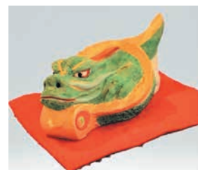
打ち出の小づちを抱えた辰の人形

参加者は、「絵付けは何度しても、難しいです」「お手本と同じ色を塗っても、それぞれ違った色合いになるのが面白かったです」と話しました。