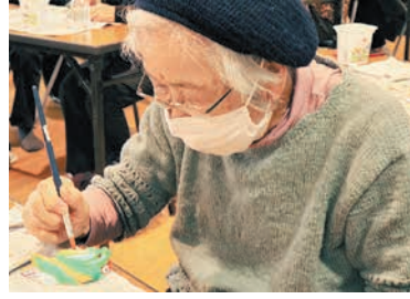
新年に思いを込めて丁寧に塗ります

博多人形の干支の絵付けを体験 田隈公民館では、校区に住む60代から90代までの20人が、干支にちなみ、辰の人形に絵付けを行いました。