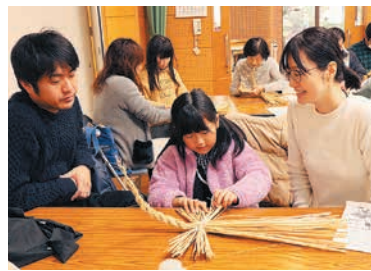
鶴が羽を広げる形に仕上げます

西新公民館では、しめ縄飾り作りが行われ、幼児から高齢者まで20組が参加しました。