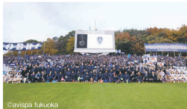
ホーム最終戦終了後、サポーターらと共に

Jリーグは、J1の18クラブの監督および選手による投票結果を基に「2023 Jリーグ優秀選手賞」34人を選出しました。