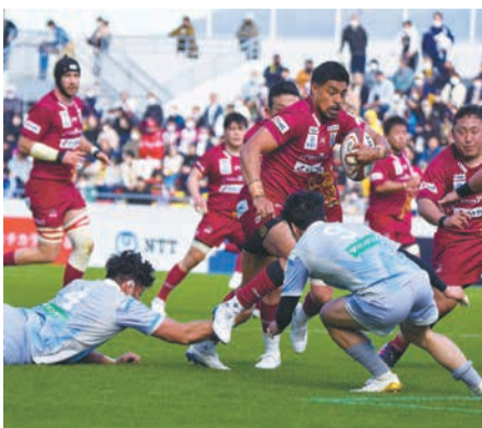
ジャパンラグビー リーグワンは、トップリーグに代わり開幕した日本最高峰の大会です

九州電力キューデンヴォルテクスは、福岡市を拠点とし、九州で唯一、ジャパンラグビーリーグワンに所属するチームです。今季からディビジョン2に昇格し、熱い戦いを続けています。1月6日(土)午後1時、ミクニワールドスタジアム北九州(小倉北区浅野三丁目)で日本製鉄釜石シーウェイブスと対戦します。