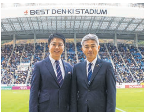
高島市長と長谷部監督

12月3日、ベスト電器スタジアム(博多区東平尾公園二丁目)で行われた、シーズン最終戦(対サンフレッチェ広島)には、シーズン最多となる1万8309人が詰めかけました。