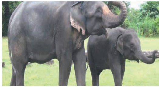
雌(22歳)と雌(3歳)は親子