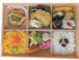
幕の内栈敷(1,500円)と呼ばれる休憩時間に座席や館内の休憩スペースでご覧ください。

また、旬の食材を使った会席料理などが味わえるレストラン(約200席)やカフェなどもあります。