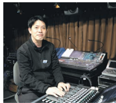
音のバランスを調整するミキサー卓。劇場全体の音響システムも担当

また、エントランスの床にはアンモナイトの化石が埋め込まれ、シャンデリアのふちには博多座の小さなロゴマークがデザインに組み込まれています。ぜひ、探してみてください。