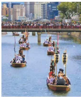
昨年の船乗り込み

式典への入場には、当日、博多座や川端ぜんざい広場、博多リバレイン等で販売される公式グッズ「博多おはじき付き手拭」(1200円)の購入が必要です。事前にホームページ(「博多座」で検索)でも購入できます。