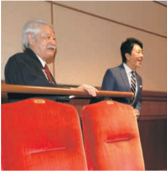
3階席奥で、本番さながらに声を出し、「大向う」を体験しました

飛梅会 声は出すけれど、姿を見せないのが「大向う」です。歌舞伎は「間」の芸。役者や演目によって微妙に「間」が違い、この「間」を捉えて声を掛けます。歌舞伎が始まった約400年前は拍手ではなく、掛け声で舞台を盛り上げていたそうです。