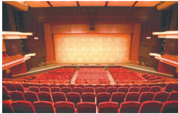
2階席正面から見た舞台。公演によって舞台を囲む枠などが変わり、ステージの雰囲気異なります