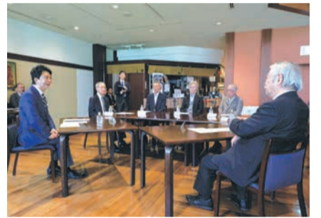
博多座で行われた飛梅会との座談会

です。しかし、皆さんの今日の落ちついた雰囲気と、あの掛け声とのギャップに驚きました。声を出す時、緊張しませんか？