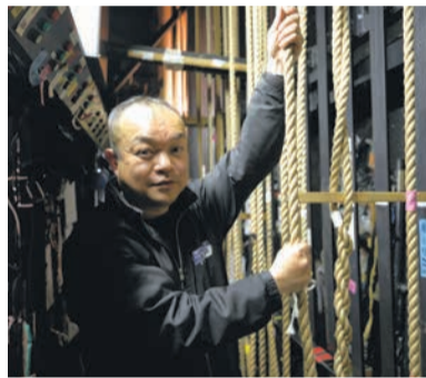
舞台装置を手動で操作する「綱元」。綱を引いてセットなどを動かします

博多座(博多区下川端町)は開場以来、歌舞伎やミュージカルなど幅広い舞台作品を上演し、多くの人に演劇の素晴らしさを届けてきました。その華やかな舞台は、たくさんの人の力に支えられています。博多座の陰の立役者にスポットライトを当てます。