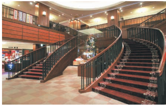
重厚感のあるじゅうたんが敷かれた馬蹄階段

博多座(博多区下川端町)は開場以来、歌舞伎やミュージカルなど幅広い舞台作品を上演し、多くの人に演劇の素晴らしさを届けてきました。その華やかな舞台は、たくさんの人の力に支えられています。博多座の陰の立役者にスポットライトを当てます。