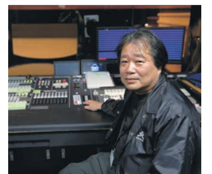
全ての照明をコントロールするオペレーション室

福岡で芝居を常に見られるようになり、文化の定着につながったのではないのでしょうか。博多座で芝居を観た若者が、俳優を目指すこともあるかもしれませんね。