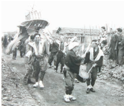
1946年5月、焼け跡を進む松囃子の傘鉾

どんたくは戦時中にも中止を余儀なくされますが、終戦翌年の昭和21(1946)年5月に復