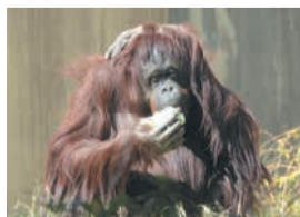
オランウータンのナナ

飼育員による餌やりの様子を間近で見学できます。4月29日(水・祝)~5月6日(水・休)に、アジアゾウ、オランウータン、コツメカワウソ、マレーグマ、キリン、シマウマ、ツキノワグマ、カバへの餌やりを行います。