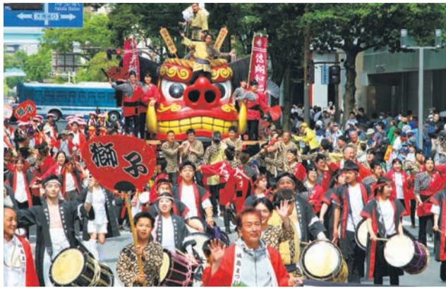
パレードでは、3~4分おきに次々とどんたく隊が登場。伝統芸能やダンス、吹奏楽など、個性豊かなパフォーマンスが楽しめる

終戦の翌年にどんたくが復活しました。今年のテーマは「どんたく復活80年今年も祝いめでたで日本一へ!!」です。「歴史に思いをはせながら、『日本一の祭り』を未来へつないでいきたい」との思いが込められています。新たに「天神ワンビル演舞台」