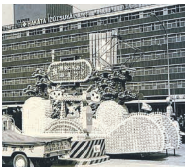
博多駅3代目駅舎(1963年~2007年)の前を走る花電車

博多どんたくは、日宋貿易に尽力した平重盛公へ感謝を伝える行事として治承3(1179)年に始まった、民俗行事「博多松囃子」を起源としています。