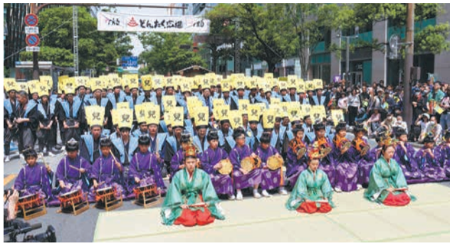
3日午後1時から、パレードの先頭を行くのは博多松囃子の一行。兒舞(ちごまい)も披露される