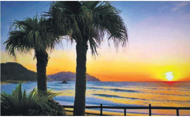
夕日に染まる北崎の海と空

れ、金印公園や志賀海神社などの歴史資源を有する志賀島(東区)、西部には、美しい海岸線やフォトスポット、カフェ等が集まる北崎(西区)があります。両地区で無電柱化を行い、海辺の景観がさらに美しくなりました。立ち寄りスポットやサイクリングで周遊できる環境の整備にも取り組んでいます。