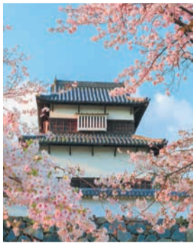
福岡城跡の伝潮見櫓(やぐら)と桜