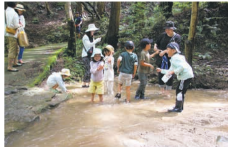
水遊びマップを園内で配布。水の流れや深さもスポットによって異なる

水が豊かで深い緑に囲まれた「水の森」エリアには、七つの水遊びスポットがあり、中でも、滝の水が岩場に白波のように飛び散る「白波の滝」は、夏の人気スポットです。サワガニやトンボなどが生息し、オオルリやキビタキなど野鳥の声を聞くこともできます。