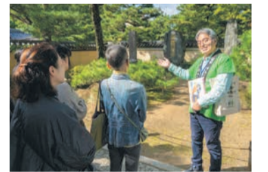
地元の歴史やエピソードに思わず、「へー」と言葉が出ます

博多祇園山笠の見どころを紹介する「博多コース」と、天神の飾り山笠を巡る「天神コース」を実施します。