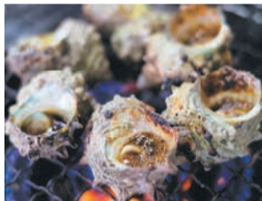
サザエのつば焼き

名物として知られるサザエは、丼や釜飯、つば焼きなどで味わうことができます。果樹栽培も盛んで、志賀島産のフルーツや蜂蜜を使ったスイーツなども楽しめます。