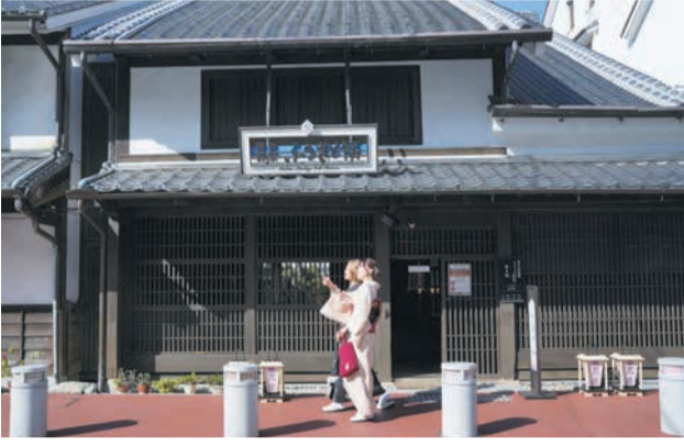
「博多町家」ふるさと館では、どんたくや山笠に関する展示も

那珂川沿いの須崎公園から清流公園にかけて、水辺を生かしたまちづくりを推進しています。川を眺めてくつろいだり、夜の景観を楽しんだりできるような整備を進めています。水上バス