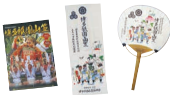
うちわ・手拭い、ガイドブックのセット