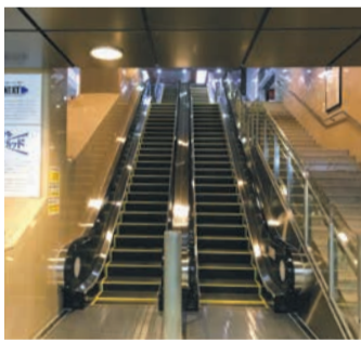
かつては途中から階段だったエスカレーターも、宿泊税を活用して改修(博多駅筑紫口)

まちの魅力が高まれば、多くの観光客に訪れてもらうきっかけになります。令和5年に国内外から福岡市を訪れた人は約2千3百万人で、市内で消費した額は推計で約6千2百億円とな