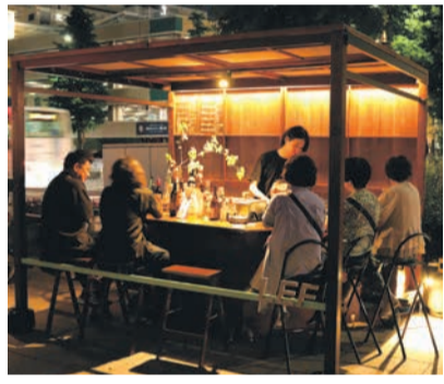
イタリアン、中華、フレンチなど個性的な料理を出す屋台も増えた