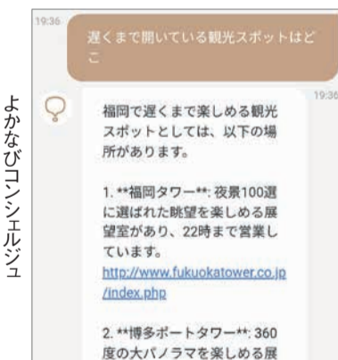
よかなびコンシェルジュ