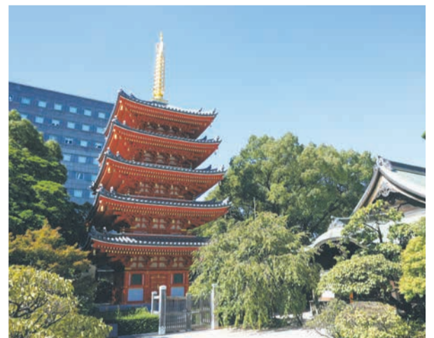
上段左からABURAYAMA FUKUOKA、無電柱化した志賀島～西戸崎の道路。下段左から天神交差点、那珂川の夜景、東長寺五重塔