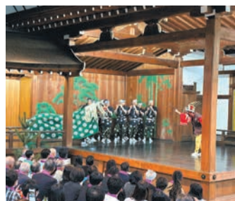
外観や内観の一部を、昭和12年の建築当時の姿に復元した住吉神社能楽殿。空調や照明、トイレも整備

宿泊税は、志賀島・北崎エリアの無電柱化など、先に紹介したまちの魅力向上に活用しています。また、市民生活の利便性の向上や安全なまちづくり、伝統文化の維持・継承、外国人観光客へのマナー啓発などにも活用されています。博多駅筑紫口の 에스