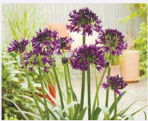
アガパンサス・ブラックジャック

植物園の大花壇エリアに、直径12mの円形型ガーデンが完成しました。植栽デザインは季節ごとに変わります。