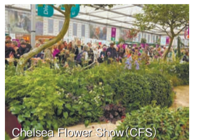
Chelsea Flower Show (CFS) イギリスの「チェルシーフラワーショー」には世界中から20万人以上が訪れ、ガーデン文化の定着や、観光推進、ビジネスの場づくりにもつながっている

植物園の大花壇エリアに、直径12mの円形型ガーデンが完成しました。植栽デザインは季節ごとに変わります。