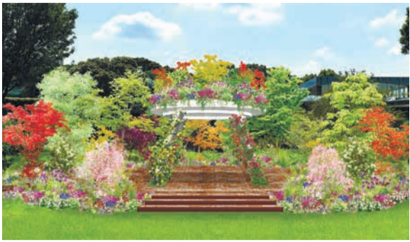
イベントステージとしても利用可能な、植物園の新たな象徴となるシンボルガーデン(イメージ)