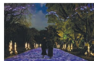
光のナイトウォーク