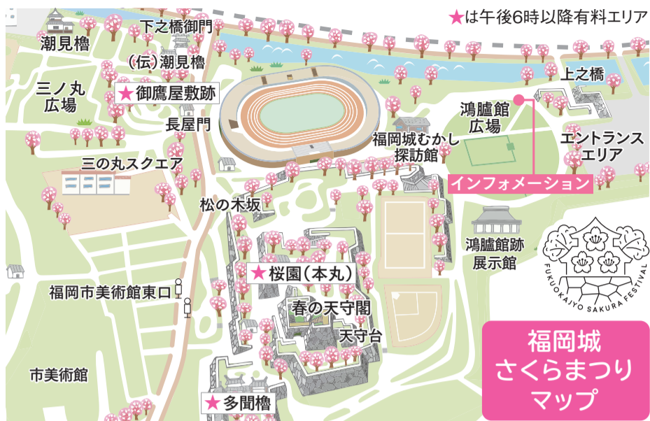
福岡城さくらまつりマップ